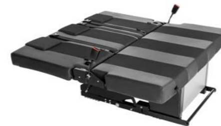
Mit dem zusätzlichen Flexboard kann die komfortable Sitz-/Schlafbank auf eine Liegefläche von ca. 130 cm x 190 cm erweitert werden.