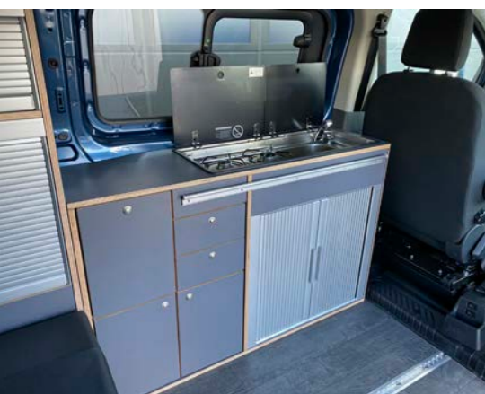
Küchenmodul mit zweiflammigem Gasherd, Edelstahlspülbecken und hochwertiger Glasabdeckung.