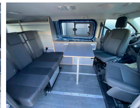
Die leicht verschiebbare 3er Sitzbank, der Klapptisch und der drehbare Fahrer- und Beifahrersitz ermöglichen eine flexible Nutzung.