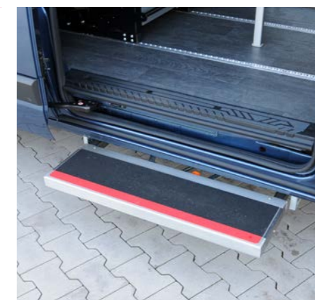
Die elektrische Trittstufe für die Seitenschiebetür ermöglicht einen leichten Einstieg.