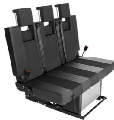
Die SMARTBENCH verfügt über integrierte Sicherheitsgurte und höhenverstellbare Kopfstützen. Eine Schublade unter der Sitzfläche sorgt für extra Stauraum.