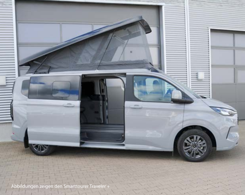
Abbildungen zeigen den Smarttourer Traveler +