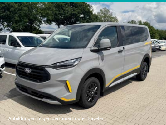
Abbildungen zeigen den Smarttourer Traveler

Das Beste daran: Mit allen drei Ausbauvarianten erhältst du die offizielle Wohnmobilm Zulassung für deinen Camper Van!