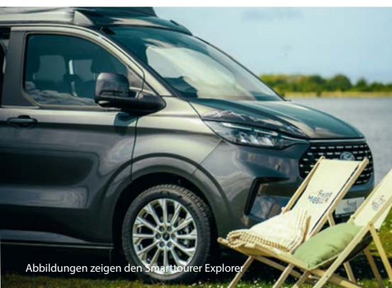
Abbildungen zeigen den Smarttourer Explorer

Mit dem Elektro-Paket Plus bist du unabhängig und bestens versorgt. Du bekommst einen Landstromanschluss mit 230-V-Steckdose, einen Wechselrichter mit 800 W Peakleistung und integriertem Ladegerät, moderne USB-A- und USB-C-Anschlüsse sowie stimmungsvolle sowie effiziente LED-Beleuchtung.